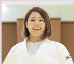
柔道家 アテネ・北京オリンピック金メダリスト 谷本 歩実 氏

オリンピック2大会連続金メダルという偉業を成し遂げたアスリートの輝かしい実績の裏には、極限状態での決断力、超集中力、そして失敗からの修正力がありました。これらは、世界と戦い抜く上で不可欠な、優れた思考力に裏打ちされたものです。本講演では、ビジネス環境が激しく変化し、新たな挑戦が求められる今、組織を力強く牽引する「気づき」や「活力」を得るヒントとして、トップアスリートとしての目標達成への覚悟や、逆境に直面した際の立て直し方など、ご自身の豊富な経験を交えながら、その思考の流儀についてお話しいたします。